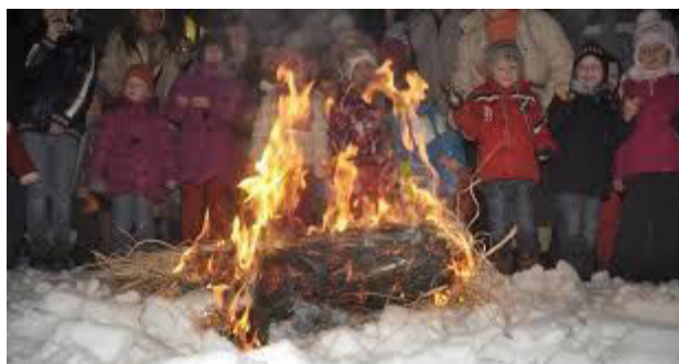
(Kische báb égetés)

A tél, az óév, a farsang, a böjt eltemetése, ha tájanként eltérő is az eredete és magyarázata, tárgyilag egy típusba tartozik: mindenütt egy élő alakoskodóról vagy élettelen (szalma)bábról van szó, akit jelképesen „megölnek és eltemetnek”. Vidékenként más névvel illették: banya, boszorkány, turka, villő, kische, kische, pilátus. - Olykor Cibere vajda és Csont király (böjtölés és a hús vétele), vagy más ifjú- és öregember megküzd egymással, ill. környezetével. - A kische általában nőnek öltöztetett szalmabáb, rongybáb (Gyergyóban ingben, gatyában levő, nagykalapú férfi-alak). Nyitrában este volt a kischevica vagy villő-báb égetésének, vízbehányásának szertartása, előtte, délután a lányok színes pántlikával díszített fűzfaágot hordozó társuk vezetésével „villőztek” (járkáltak, →villőzés). Gyergyóban a báb éjféli hóbatemetése előtt, húshagyó délutánján nagy csapat alakoskodó kíséretében meghurcolták a forgóbábokat, kerékre illesztett fiú és leány bábfiguráját; a kereket rúdjánál fogva gyermeksereg hurcolta, mögötte az alakoskodók pattogtattak ostorukkal, amely nyaklóján piros szalaggal volt felcífrázva; a lánybáb fején is piros kendő. Orbán Balázs szerint a temetőben-torozás emlékeként maradt meg az egyik székely szokásban, hogy a felcífrázott bábbal együtt gyalogszánon v. targoncán a húshagyói ételek maradékát is kivitték a temetőbe, s az eltemetett farsang torát ott ülték meg.